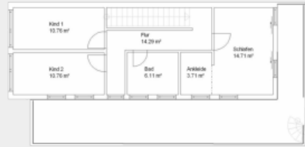
Grundriss Dachgeschoss 60,34 qm