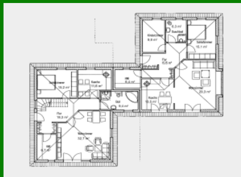
Variante 3 & 4